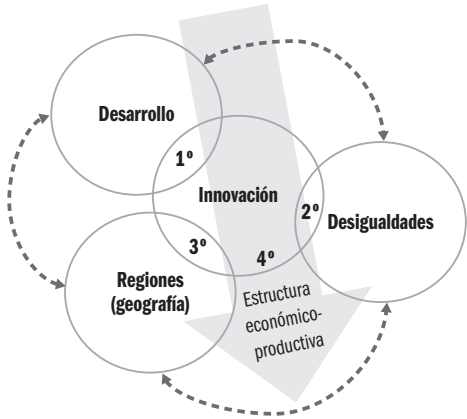
Figura 1. Esquema (simplificado) de la revisión de la literatura

Debido tanto a una finalidad práctica de ordenamiento del trabajo como a la multiplicidad de aristas que bien pueden tomar las cuestiones bajo análisis, se procederá a subdividir el abordaje en distintas partes –aunque vinculadas entre sí, como veremos en el paso de una sección a otra– y se irán analizando las relaciones entre pares temáticos, tomando siempre la innovación como “pivote” (figura 1). Es decir, luego de esta introducción, la siguiente sección se ocupará de analizar los vínculos entre los procesos de innovación y desarrollo. Luego, se indagará en las posibles conexiones entre la innovación y las desigualdades –en particular, aunque no exclusivamente, territoriales–. Esto nos dará pie para ahondar, en el siguiente apartado, en la geografía de la innovación y el papel que juegan las regiones. Por su parte, la quinta sección destacará la importancia y transversalidad de la estructura económico-productiva para dar cuenta de la innovación –y obviamente también del desarrollo–. Finalmente, dejaremos un apartado para hacer un balance integrador.