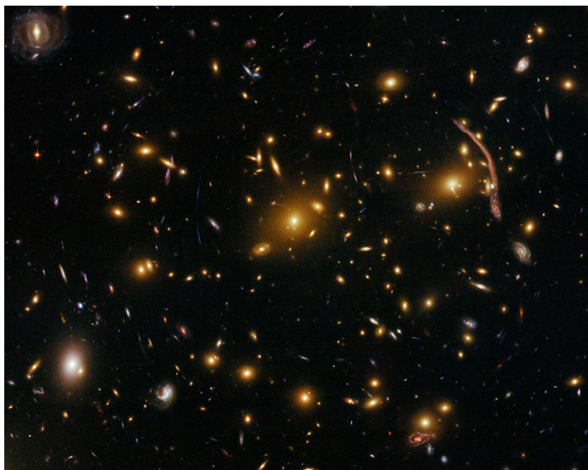
Figura 3. Imagen de lentes gravitacionales tomadas por el Telescopio Espacial Hubble