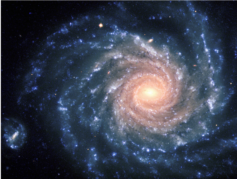
Figura 1. Galaxia espiral llamada NGC 1232

Uno de ellos, posiblemente el más claro, es el movimiento de las galaxias espirales. Este tipo de galaxias se caracteriza porque las estrellas y el polvo que la componen se distribuyen principalmente sobre un plano y presentan un centro muy denso del cual emergen brazos espirales. En la figura 1, vemos una galaxia espiral NGC 1232. Este tipo de galaxias, debido a su importante movimiento de rotación, fue el primero que permitió determinar la velocidad de rotación de las estrellas que la componen.